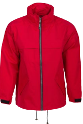
WINDY JACKET 150839 Page 41