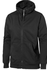
MIDLAND HOOD 150461 Page 24