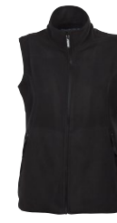
KVITSEID LADY 150875 Page 31