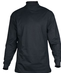
ROLLIE 150319 Page 27