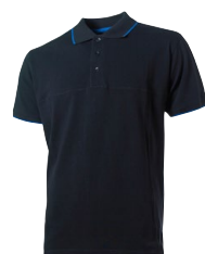
TUCSON 150358 TUCSON LADY 150359 Page 13