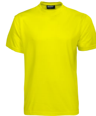
ORIGINAL NEON 150313 Page 6