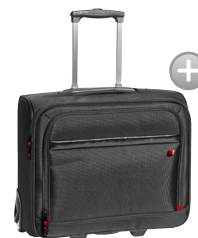
PRO LINE 158812-15 Page 50-51