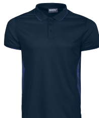
BELLEVILLE 150335 Page 15