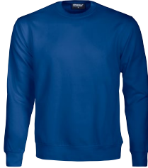
MIDLAND CREW 150460 Page 23