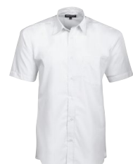
CLARK MAN S.SLEEVE 150954 Page 18