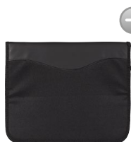
BLACK LINE 158240-85 Page 57-62