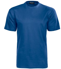
ORIGINAL 150315 Page 7