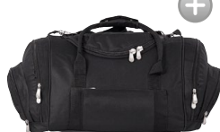
BUSINESS LINE 158290-95 Page 47-48