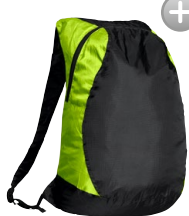
COMPAC LINE 158603-604 Page 46