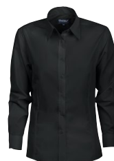
CLARK LADY L.SLEEVE 150957 Page 18