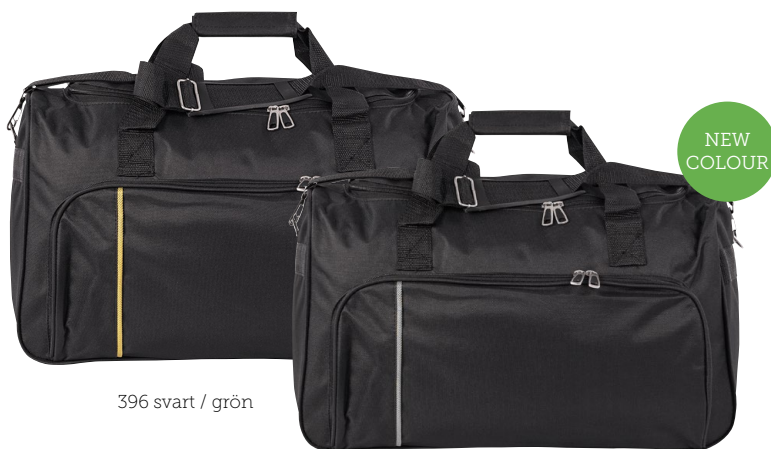
396 svart / grön