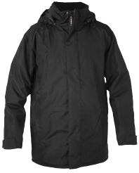
AUSTIN 150824 Page 35