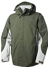
RIVERSIDE 150853 Page 42