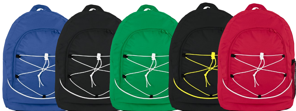
371 blå / vit