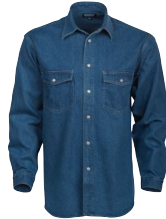
SAN DIEGO LADY 150272 Page 19