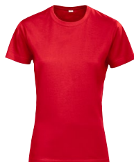
ROCK T LADY 150375 Page 10