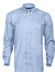
OXFORD L.SLEEVE 150976 Page 17