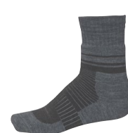
SOCKS 150578-83 Page 77