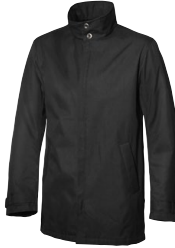
LAWSON 150802 Page 37