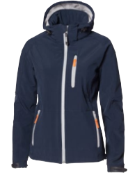
TULSA LADY 150863 Page 38