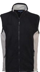
GAUSTA 150887 Page 31