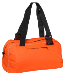
REVERSIBLE LINE 158724 Page 63