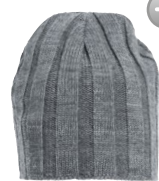
SEGER HATS 150621-29 Page 76