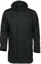
ANGUS 150866 Page 39