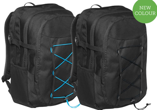
397 svart / turkos