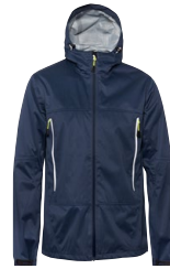
CHESTER 150870 Page 36