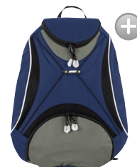
STREET LINE 158301-02, 04-06 Page 67-68