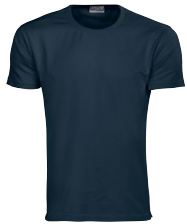
GEMINI 150326 Page 7