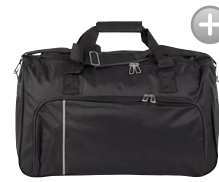
PIPE LINE 158612-15 Page 55-57