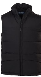
DELANO 150801 Page 44