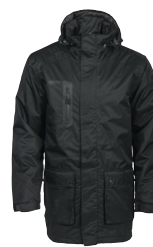
RIPON 150816 Page 34