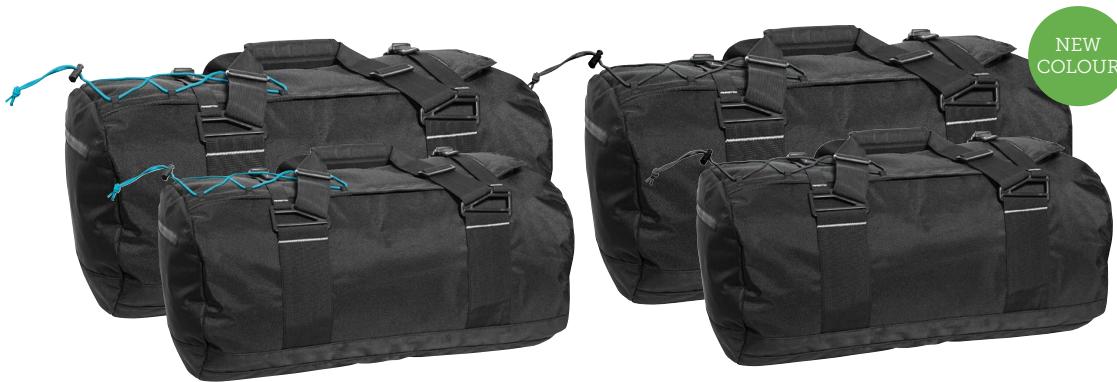
397 svart / turkos