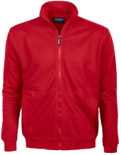
MIDLAND FULL ZIP 150463 Page 22