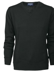
HAYDEN LADY 150533 Page 27