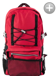
SILVER LINE 158040-49 Page 69-71