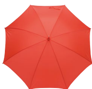
NOTTINGHAM 145600 Page 75