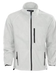
TRONDHEIM 150885 TRONDHEIM LADY 150886 Page 30