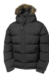
NEBRASKA 150848 Page 33