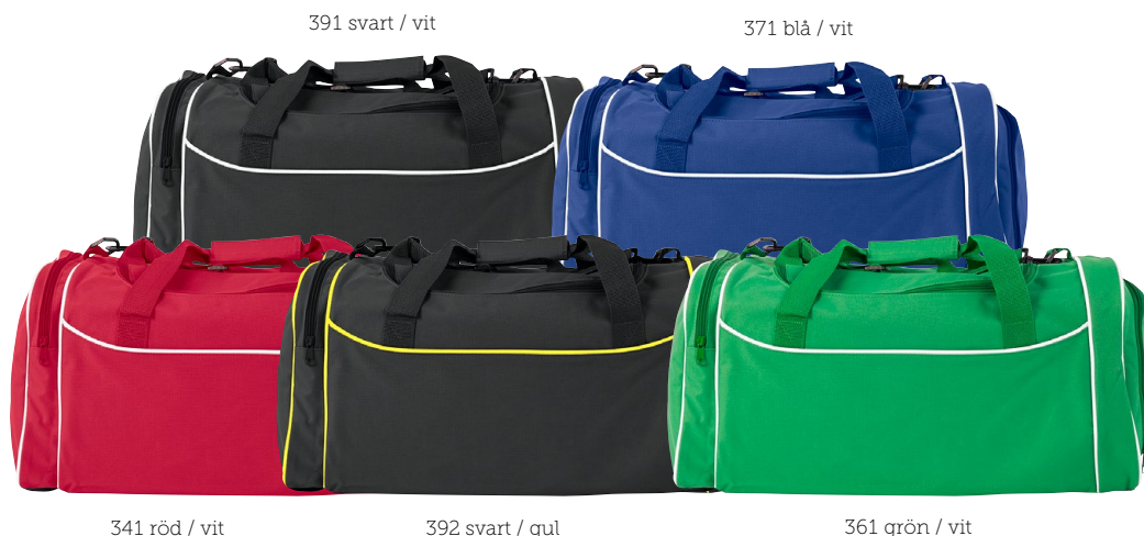
391 svart / vit

The optimal bag line for all sports clubs. Affordable and available in the most sought after team colours.