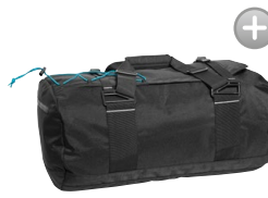
SPORTY LINE 158822, 158824 Page 54-55