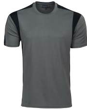
SPORTS TEE 150312 Page 6