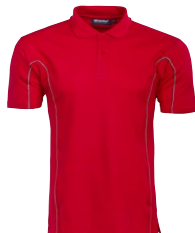
KENTON 150355 Page 14