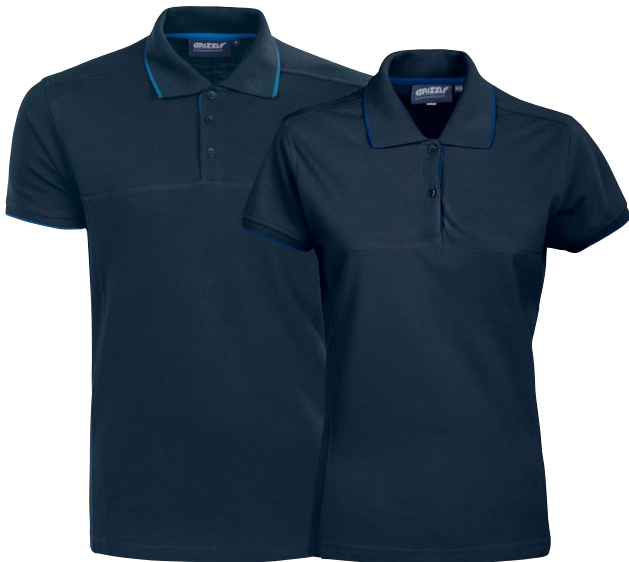
850 marin / blå