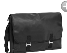
WATER LINE 158341, 43, 45 Page 73