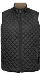
DERRY 150840 Page 43