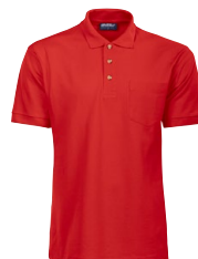
COTTON 150352 Page 13