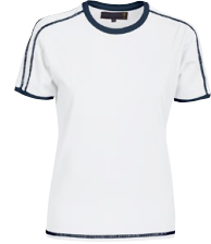
DUNVILLE 150329 Page 9