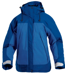
ASPEN 150855 Page 35