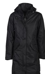
RIPON LADY 150817 Page 34