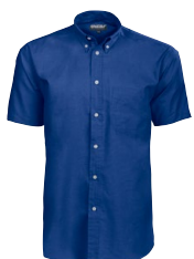
OXFORD S.SLEEVE 150975 Page 17