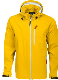
TULSA 150862 Page 38