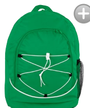
CLUB LINE 158026-27 Page 66