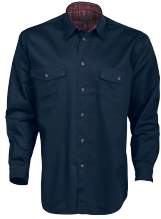
TWILL 150242 Page 19