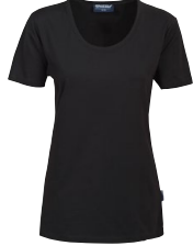
SELMA 150304 Page 8