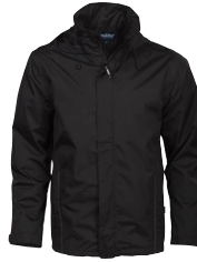
BROCK JACKET 150864 Page 40