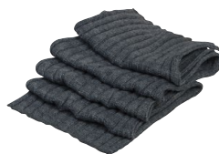
RIBBED SCARVES 150630 Page 75