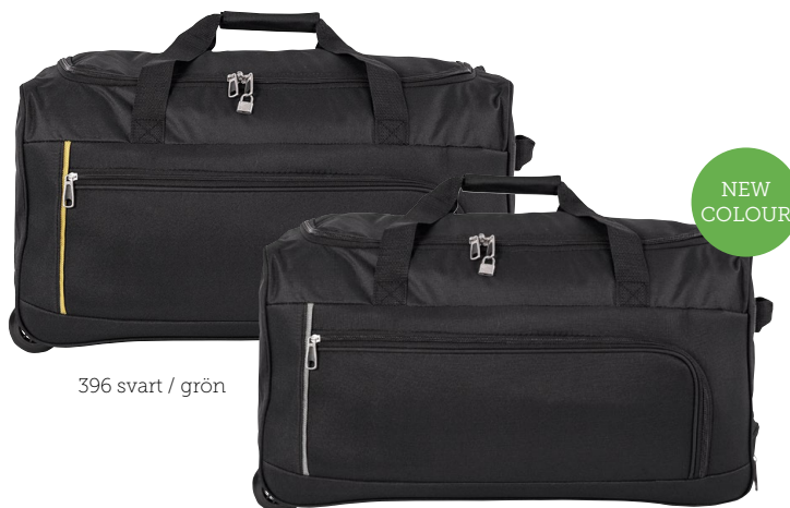
396 svart / grön