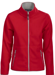
PERRIS LADY 150891 Page 29