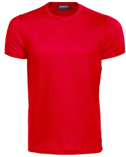
PONTVILLE 150333 PONTVILLE LADY 150334 Page 5