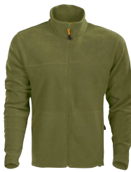
ALVISO 150880 Page 30