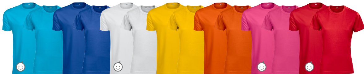
744 mörk turkos