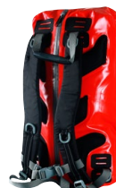
PRO-TECT LINE 158350-01 Page 74