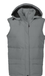
POINT LAY LADY 150852 Page 44