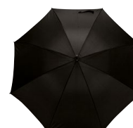
BRADFORD 145601 Page 75