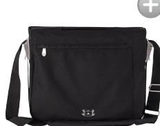
OFFICE LINE 158801-02 Page 53