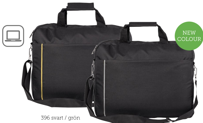
396 svart / grön