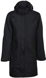
ANGUS LADY 150867 Page 39