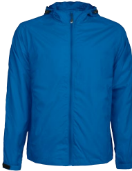
RUSKIN 150879 Page 39