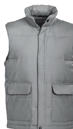
POINT LAY 150851 Page 44