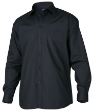
CLARK MAN L.SLEEVE 150955 Page 18