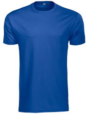
ROCK T 150374 ROCK T JUNIOR 150174 Page 10