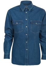
SAN DIEGO LADY 150273 Page 19