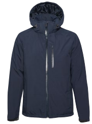
COVINA 150762 Page 36