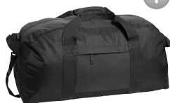
GREEN LINE 158713-14 Page 46-47