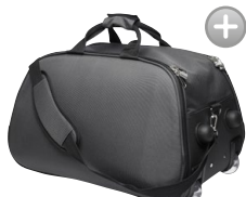
STREAM LINE 158313 Page 52