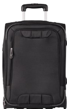
TROLLEY LINE 158615 Page 52