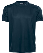
TECHNICAL TEE 150324 Page 6