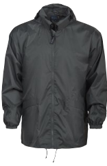
DELAWARE 150871 Page 41