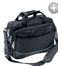
SKY LINE 158402-08 Page 48-49