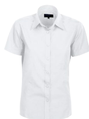
CLARK LADY S.SLEEVE 150956 Page 18