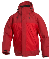
ASPEN LADY 150856 Page 35