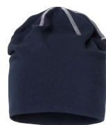
AKKA HAT 150631 Page 75