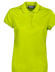
BELLEVILLE LADY 150336 Page 15