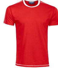
DENVER 150328 Page 9