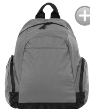
EVER LINE 158701-05 Page 63-65