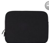
NEOPRENE CASE 158238-39 Page 72