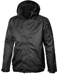
RIDGE 150868 Page 37