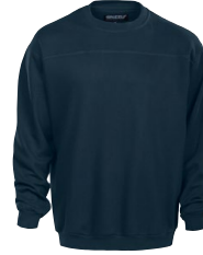
FIRST BASE SWEATSHIRT 150481 Page 25