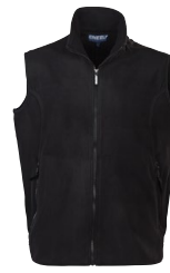
KVITSEID 150874 Page 31