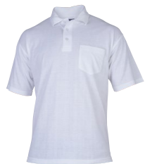
BARCELONA 150349 Page 14