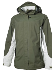
RIVERSIDE LADY 150854 Page 42