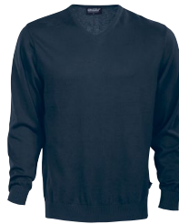
HAYDEN 150532 Page 27