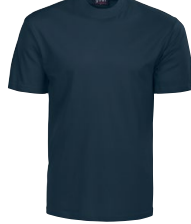
GOAL T-SHIRT 150650 Page 8