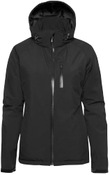
COVINA LADY 150763 Page 36