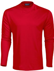
GOAL LONGSLEEVE T-SHIRT 150652 Page 26