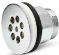
Silventil kort Utan bräddavlopp. Över- och underdel i förkromad mässing. Utv R32. Art nr 8560017