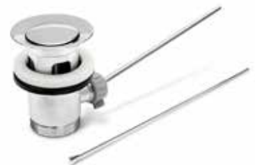
Lyftventil med lyftstång Över- och underdel samt lyftstång i förkromad mässing. Utv R32. Art nr 8560015