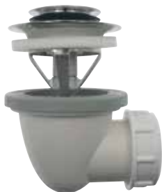
Pop-up ventil För badkar. Överdel i förkromad mässing och underdel i plast. Utlopp 32 mm. Art nr 7319732