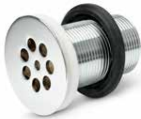
Silventil lång Utan bräddavlopp. Över- och underdel i förkromad mässing. Utv R32. Art nr 8560018