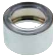
Distansring För tvättställ, utan bräddavlopp. Förkromad mässing. Art nr 8573587