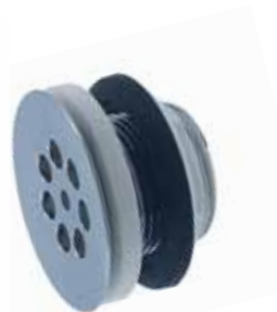
Silventil kort för utslagsback Utan bräddavlopp. Över- och underdel i förkromad mässing. Utv R32. Art nr 8560083