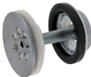
Silventil Över- och underdel i förkromad mässing. Utv R32. Art nr 8573585