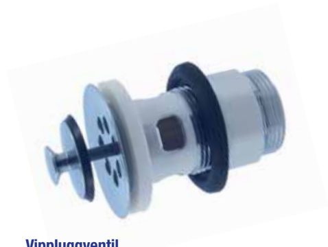
Vippluggventil Över- och underdel i förkromad mässing. Utv R32. Art nr 8560082