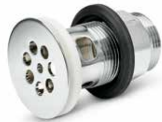
Silventil Över- och underdel i förkromad mässing. Utv R32. Art nr 8560016