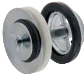
Vippluggventil Över- och underdel i förkromad mässing. Utv R32. Art nr 8573584