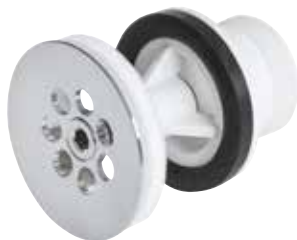
Silventil Förkromad mässingsöverdel med plastunderdel. Utv R32. Art nr 8573582