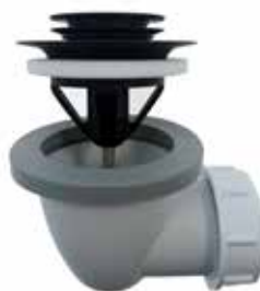
Pop-up ventil För badkar. Överdel i svart mässing och underdel i plast. Utlopp 32 mm. Art nr 8560103