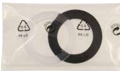
Packningssats Till vipplugg- och silventiler. Passar till samtliga Alterna Bottenventiler Art nr 8573603