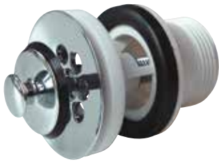
Vippluggventil Förkromad mässingsöverdel med plastunderdel. Utv R32. Art nr 8573574