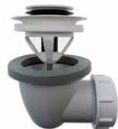
Pop-up ventil För badkar. Överdel i vit mässing och underdel i plast. Utlopp 32 mm. Art nr 8560107

Komplett med utloppsror 32 x 160 x 600 mm, vit. Art nr 7319733