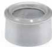
Distansring För tvättställ, utan bräddavlopp. Förkromad ABS. Art nr 8573606