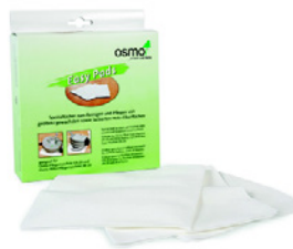
3 Osmo Easy Pad