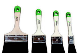
7 Osmo Pensel