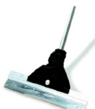
10 Osmo stålspackel