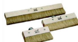
8 Röd/vit Doodlebug