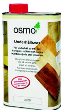
2 Osmo 3029/3087 Underhållsvax